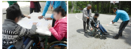
Şekil 4. Oyun 3: Yılan Oryantiring