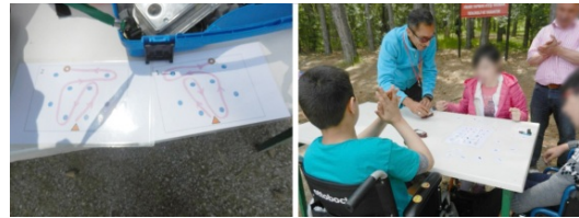
Şekil 3. Oyun 2: Puzzle Oryantiring