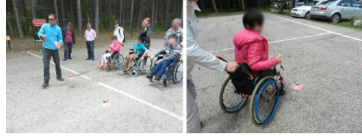
Şekil 2. Oyun 1: Labirent Oryantiring

alanlarında sağlıklı çocuklar gibi oyun oynayabilir, eğitimle oyun bilincine varabilirler, oyun kurallarına uymayı öğrenebilirler. Özellikle yürüme engeli bulunan çocukların açık havada eylemlerini herhangi bir fizyolojik ve psikolojik rahatsızlık duymadan yerine getirebilmelerinin sağlanabilmesi için uygun koşulların sağlanması gerekmektedir. Bu çocukların fizyolojik, boyutsal, görsel olarak sağlıklı ve emniyetli bir şekilde ihtiyaçları giderilmesi sağlanmalıdır. Tekerekli sandalye kullanan fiziksel engellilerin çeşitli park donatılarını kolayca kullanmalarını ve kendi sandalyesinden bu ekipmanlara kolayca geçiş yapabilmeleri için gerekli olan ergonomik koşulların oluşturulması ve bu amaçla yardımcı tutunma kollarının uygun yerlerde olması gerekmektedir. Ayrıca bu kullanıcıların tehlike anında destek alabilmeleri için alanın ulaşılabilir noktalarında bir merkeze bağlı çağrı/yardım kutuları yer almalıdır.